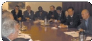
Une délégation de l'UPA s'est jointe à des producteurs d'une cinquantaine de pays pour rencontrer le directeur général de l'OMC et le président du Comité des négociations agricoles, à Genève, le 22 mars 2006.

De séminaires en ateliers et de forums en conférences internationales, la position émergente du monde agricole en faveur de la souveraineté alimentaire a fait l'objet de nombreuses déclarations internationales signées par un nombre croissant d'organisations. Le 22 mars 2006, à Genève, des représentants de la coalition GO5 et de l'UPA se sont joints à d'autres organisations agricoles provenant de 52 pays d'Asie, d'Afrique, d'Amérique et d'Europe afin de rencontrer Pascal Lamy et Crawford Falconer, respectivement directeur général de l'Organisation mondiale du commerce (OMC) et président du Comité des négociations agricoles. À l'occasion de cette rencontre, ils leur ont remis en mains propres une déclaration proclamant le droit des peuples à la souveraineté alimentaire. Cette déclaration rappelle que moins de 10 % de la production agricole mondiale fait l'objet d'un commerce international et que la ronde de Doha porte sur le développement, non sur l'accès aux marchés. On y précise que « les règles commerciales doivent permettre le maintien des politiques favorisant la souveraineté alimentaire et la stabilité des prix, incluant la gestion de l'offre et les mesures de sauvegarde. » Lors de la rencontre avec Pascal Lamy, ce dernier a signifié aux producteurs agricoles que leur présence à Genève arrivait à point, à 40 jours de l'échéance pour terminer les travaux sur les modalités.