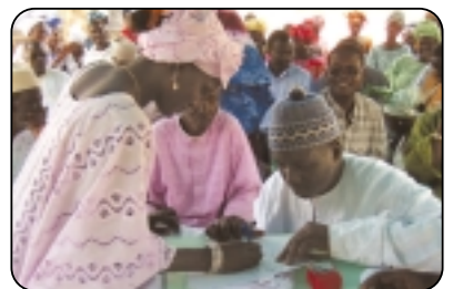
Remise d'un fonds de développement au groupement villageois de Lonkane, au Sénégal, dans le cadre du programme Les Savoirs des gens de la terre , le 1 er avril 2006.