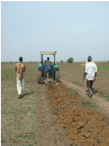
La COMABM a fait l'acquisition d'un tracteur et d'une herse à disques avec l'appui financier de la Coopérative Fédérée de Québec. Le service de labour aux membres non motorisés démarrera sous peu.

Dans la Boucle du Mouhoun, une région située à quelque 200 kilomètres à l'ouest de Ouagadougou, des producteurs se sont regroupés pour mettre en place une coopérative d'entretien et de réparation de machinerie agricole. La mission de la Coopérative de mécanisation agricole de la Boucle du Mouhoun (COMABM) est de fournir à ses membres des services de réparation et des pièces de rechange.