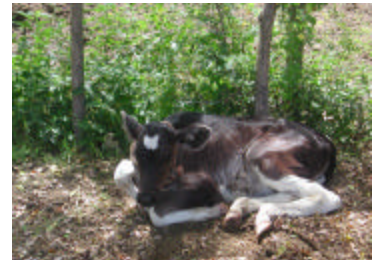
Jeune génisse obtenue d'une vache laitière récemment achetée par la Coopérative San Alfredo dans le cadre du projet appuyé par la Fédération des producteurs de lait du Québec (FPLQ).

À San Alfredo, 6 génisses sont nées des 12 vaches achetées au cours de l'année. La production s'est évidemment accrue par l'ajout de ces nouvelles vaches de meilleure génétique dans le troupeau, chacune produisant plus de 20 bouteilles par jour au lieu des 15 bouteilles qui représentaient la moyenne du troupeau. Un espace de corral a été aménagé, lequel permet de garder les animaux plus propres et à l'abri du soleil très chaud de mi-journée. Sept manzanas sont maintenant en production à l'année et fournissent un fourrage quotidien de sorgho pour le bétail.