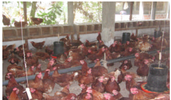
Les coopératives Tres de Enero, las Mujeres progresistas et Santa Clara ont diversifié leur production agricole en construisant chacune un poulailler d'une capacité de 500 pondeuses. Ces nouvelles infrastructures ont été réalisées avec l'appui financier de la FPOCQ et d'INCOBEC.

Les poulaillers des coopératives Tres de Enero, Las Mujeres progresistas et Santa Clara sont en production et la vente des œufs est bien enclenchée. On évalue une production d'environ 750 douzaines d'œufs par semaine au sein de ces trois coopératives.